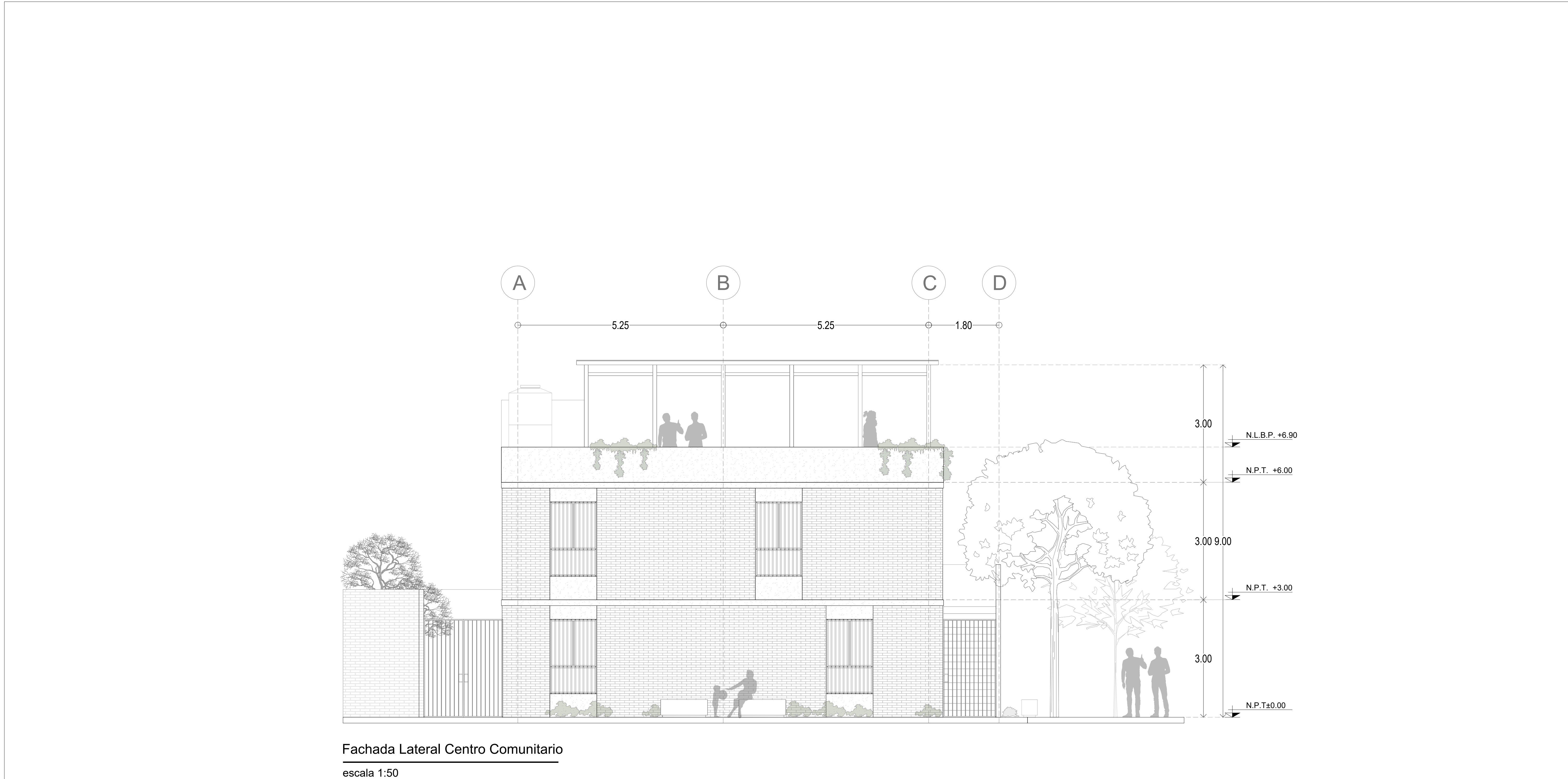
Fachada Lateral Centro Comunitario escala 1:50